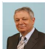
JL PERAT Président du Réseau des Ruches Député du Nord